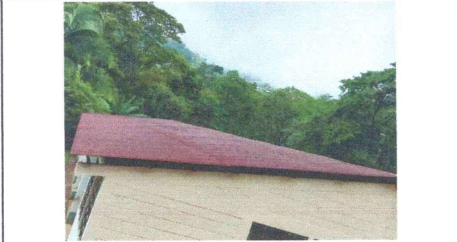
Foto1: El techo del modulo 1 y 2 del establecimiento requiere sustitucion de techo.