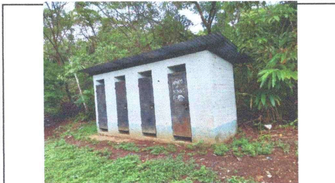
Foto 3: Los sanitarios del establecimiento requieren sustitucion de entechado, ya se encuentran deteriorado.