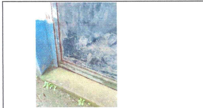
Foto 5: Cambio de puertas de las aulas del modulo 1 y 2, se encuentran deterioradas.