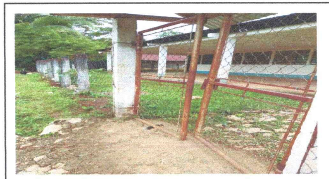
Foto 4: Se observa el porton de la escuela en mal estado, se encuentra oxidado y requiere cambio.