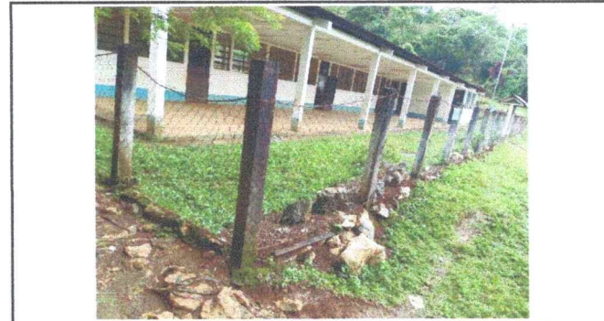
Foto 6: La malla se encuentra en mal estado y rota, necesitamos el cambio.

Observación: Si es necesario se pueden agregar hojas adicionales y actualizar el número de hojas.