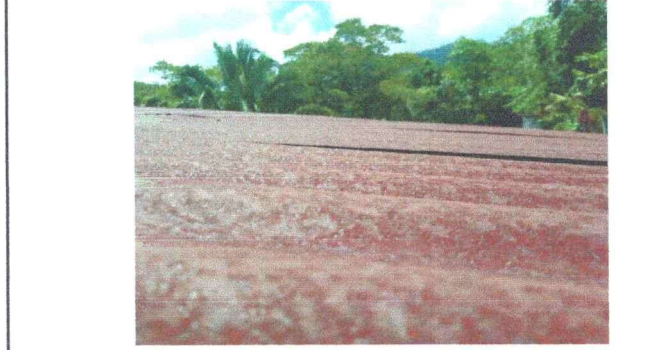
Foto1: El techo del modulo 3 del establecimiento requiere sustitucion de techo.